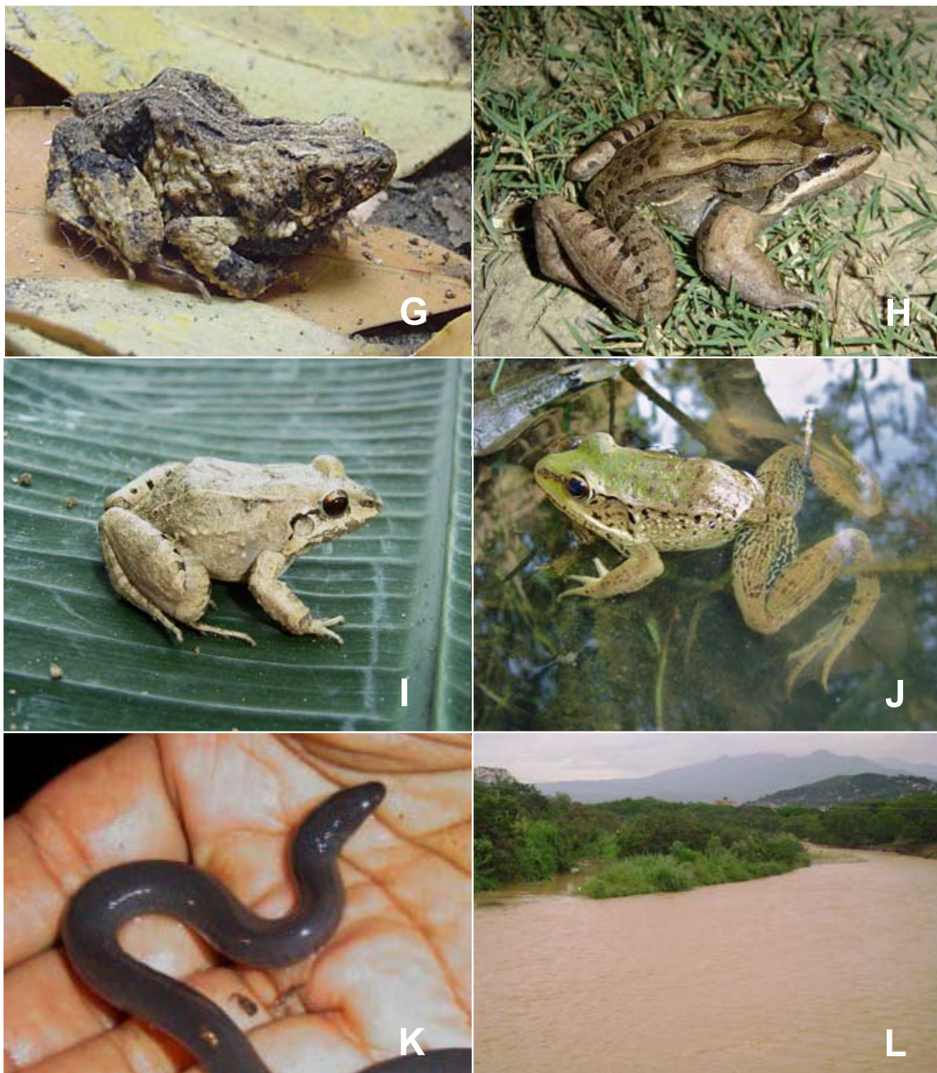
FIG. 1. Cont. Registro fotográfico de especies en el área de estudio. (G) Engystomops pustulosus , (H) Leptodactylus insularum , (I) Leptodactylus poecilochilus , (J) Lithobates palmipes , y (K) Typhlonectes natans . (L) Vista del río Pamplonita.

Photographic record of species in the study area. (G) Engystomops pustulosus , (H) Leptodactylus insularum , (I) Leptodactylus poecilochilus , (J) Lithobates palmipes , and (K) Typhlonectes natans . (L) View of Pamplonita river.